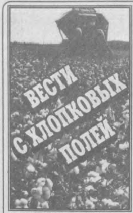
ПОМОГАЕТ АНДИЖАНСКИЙ МЕТОД Хлопководы Атырауского и Ферганского районов выполнили годовое задание по производству и...

1 ноября 1997 года суббота № 207 (23640) Цена свободная