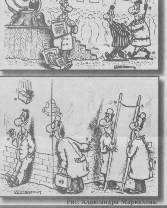
Рис. Александра Маркелова.

тыми и смеяться над легкими деньгами. Это классическая защита бедняков", - объяснил появление новой темы популярный сатирик Евгений Петросян.