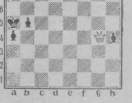
Мат в два хода. ЗАДАЧА