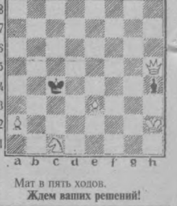
Мат в пять ходов. Ждем ваших решений!