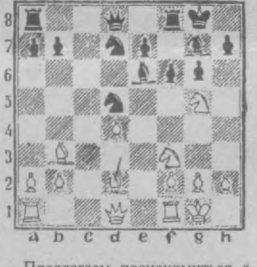
Мат в два хода. ЗАДАЧА