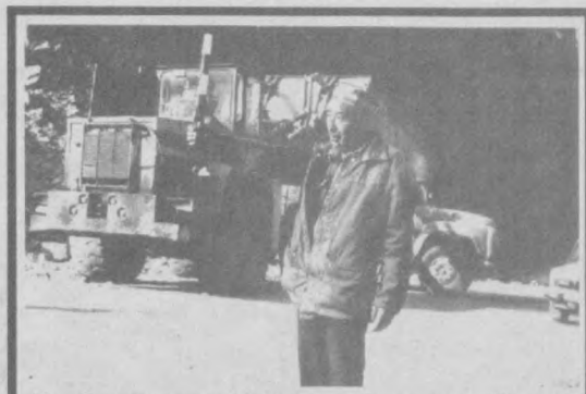
В полном разгаре строительные работы на трассе "Ташкент-Ош". Эта автомагистраль - единственная связующая нить столичной области с густонаселенной Ферганской долиной: Она короче, пройдет через тоннели, а главное, безопаснее той, которая проходит по территории соседнего Таджикистана. В более отдаленной перспективе дорога, соединяя два братских государства - Узбекистан и Кыргызстан, по караванным тропам Великого шелкового пути выведет к Китаю. Так что стройка важная.