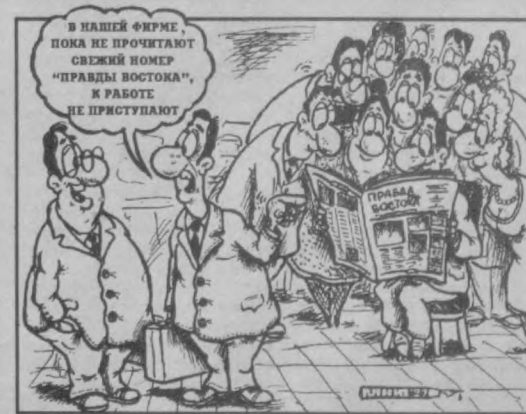
В НАШЕЙ ФИРМЕ ПОКА НЕ ПРОЧЕТАЮТ СВЕЖИЙ НОМЕР "ПРАВДЫ ВОСТОКА", К РАБОТЕ НЕ ПРИСТУПАЮТ