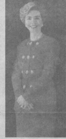
первую леди, доверять ей и смотреть на нее как на образец для себя.

Недавно президент подписал закон об изменении порядка социальной помощи в США. Раньше здесь можно было всю жизнь не работать и получать поддержку от государства. Достаточно было, чтобы тебя признали бедняком и начали выывать "вэл-фэр" - помощь по бедности. Ее можно было получать всю жизнь, чем и пользовались миллионы тех, кто не хотел заниматься трудом, а считал за лучшее сидеть на