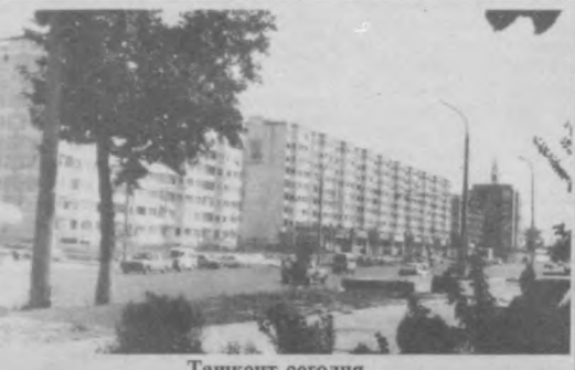
Ташкент сегодня.