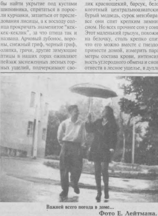
Важней всего погода в доме...