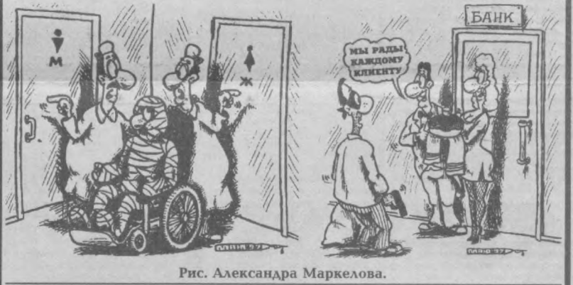
Рис. Александра Маркелова.

В ассортимент вошли чай, сахар, рис, кинешит и другие лакомства. Когда реф захочет о здоровье людей - шутки в сторону! К сожалению, не все помнят об этом... Заблестели глаза, и все молодое, нестрастное выплунулось наружу.