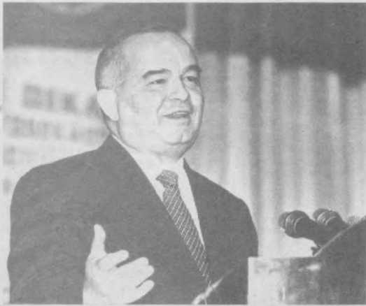
Уважаемые друзья! Дорогие соотечественники! Разрешите мне, воспользовавшись случаем, поздравить вас с 5-летием Конституции Узбекистана и выразить вам свое искреннее уважение.