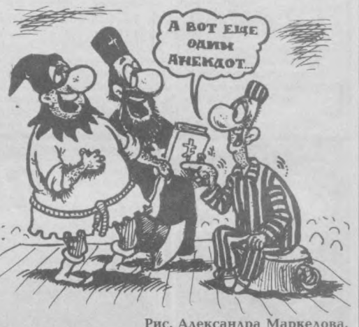
Рис. Александра Маркелова.

Вечно ходить с траурным выражением лица так же неестественно, как и постоянно изобразить из себя весельчачку. Но бесспорно то, что шутка всегда должна найтись место. А есть ли чувство юмора у тебя? Проверь это, ответив на вопросы теста. 1. Придя на вечеринку, ты замечаешь, что одета совершенно обильно, в то время как на всех гостей пижамные наряды. Какой будет твоя реакция? А. Покину праздник. В. Пронигорирую различие и буду вести себя совершенно неприлично. С. Попрошу у хозяйки нарядные платья. 2. Представь, что ты в одиночестве стоишь на крыше высотного здания. Что бы ты сделала с наибольшим желанием? А. Громко бы запела или что-нибудь крикнула. В. Как можно быстрее спустилась бы вниз. С. Подошла бы к самому краю и глянула вниз. 3. Развалив старого замка кажется тебе: А. Интригуешь. В. Устрашаешь. С. Романтизируешь. 4. Как ты воспринимал бы непредвиденные обстоятельства, которые сбивают тебя с отлаженного ритма жизни? А. В этом состоит пикантность жизни. В. Это всегда удручает. С. Зависит от конкретной ситуации. 5. Озорница, чужой ребенок показывает тебе язык. Как ты на это реагируешь? А. Сделю то же самое.