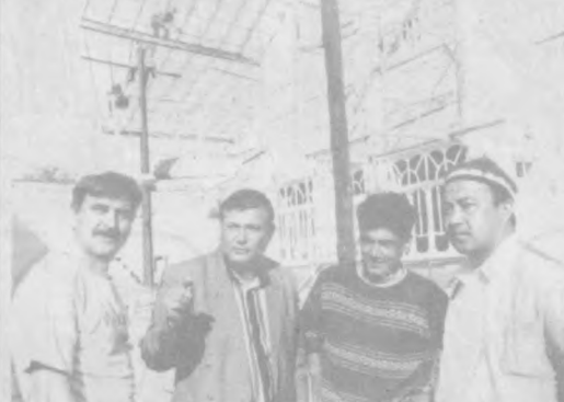
В Джизаке уделяется большое внимание строительству газуров. Сейчас их в городе 12. В эти дни завершается строительство еще одного газура. Его назвали "Раваллик". Оформлен он в восточном стиле.

Наиля Искандерова. Соб. корр. "Правды Востока". Кашкардарьинская область.