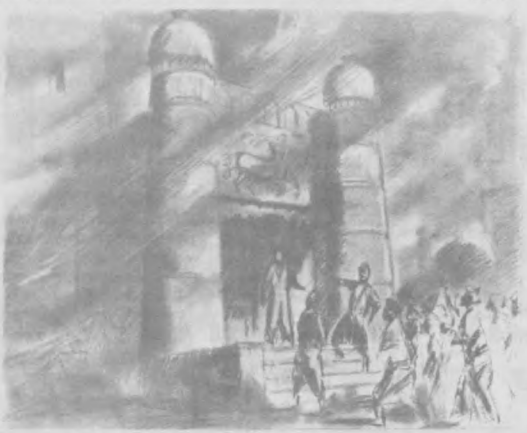
НА ФОТОРЕПРОДУКЦИЯХ: эскизы Варшамы Еремяна к кинофильмам "Алишер Навои" и "Авиценна".