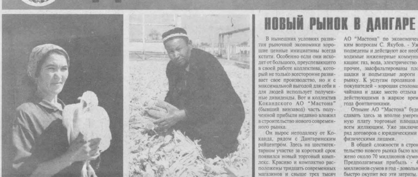
Гулистанская птицефабрика в прошлом стабильно обеспечивала голодноостепевые районы и мясом. Но постепенно, в силу экономических трудностей, утратила свои позиции. Коллектив сумел справиться с трудностями. В настоящее время разработаны мероприятия по увеличению выпуска продукции. Отлично, что ныне детсады стали получать с фабрики мясо и яйца, чего уже не было несколько лет.