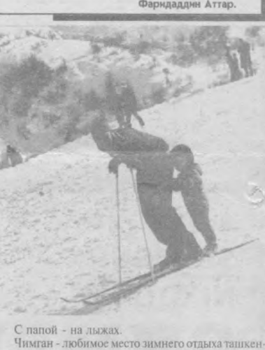
С папой - на лыжах. Чимган - любимое место зимнего отдыха ташкентцев.