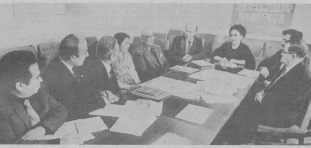
НА СНИМКЕ: участники заседания за «столом деловых встреч».

А. АБИДОВ: — Вспоминаю такой случай. Как-то пришлось разбираться с одним из руководителей среднего звена. В коллективе у него были хорошие специалисты, в распоряжении современная техника, а производственные показатели не растут. На одном уровне «заморозились», план доставался непомерно дорого. «В чем дело?» — спрашиваю у рабочих. Ветеран за всех ответил: «Попытки создавать новую про-