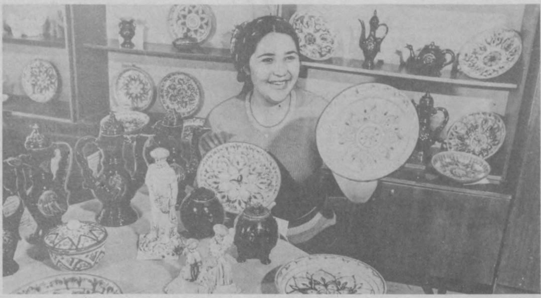
Высокими показателями начал первый год двенадцатой пятилетки коллектив Хивинского завода художественно-керамических изделий...