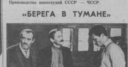
Авторы сценария — Б. Металликов, А. Вагенштайн. Режиссер — Ю. Карасик.