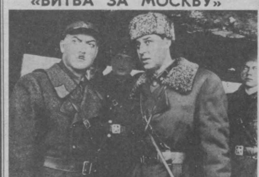
ФИЛЬМ ВТОРОЙ «ТАЙФУН» (2 серии) Автор сценария и режиссер — Ю. Озеров.