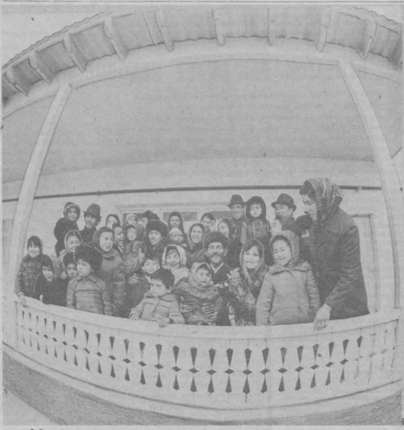
Новоселье на улице Многодетной