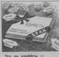
Что ни конфеты — явный брак. Гонт фабрика «Уртак». Рис. В. МУРОМЦЕВА.

Хотим надеяться, что бракоделы отступят рублем. Л. ПОЛТАВСКАЯ, Главный государственный инспектор.