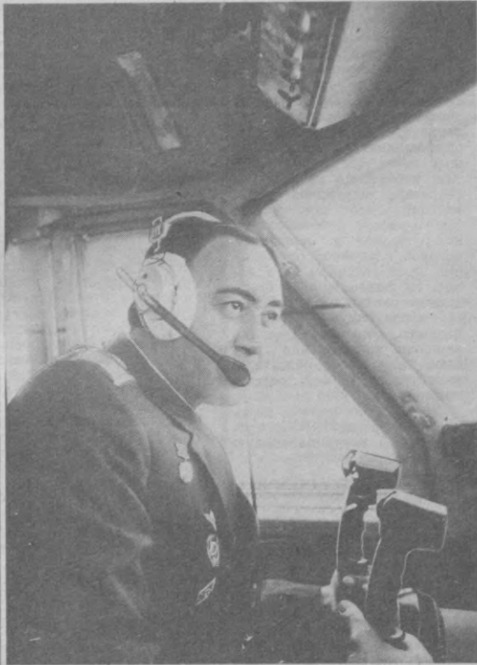
ДЕЛЕГАТ XXVII СЪЕЗДА КПСС

Честный и чистый облик партия приобрел особое значение сейчас, в период подготовки к XXVII съезду КПСС, обсуждения проектов новой редакции Программы КПСС и изменений в Уставе партии. Начало нового этапа нашей жизни предвещает и коммунистам и новым, повышенным требованиям. Единство слова и дела, партийная совесть и честность, инициатива и ответственность, требовательность к себе и товарищам — вот характерные черты настоящего коммуниста. Быть такими не на словах, а на деле — нет важнее и благороднее задачи.