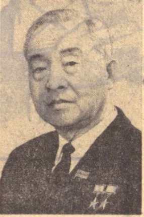
Ким Пеп ХВА