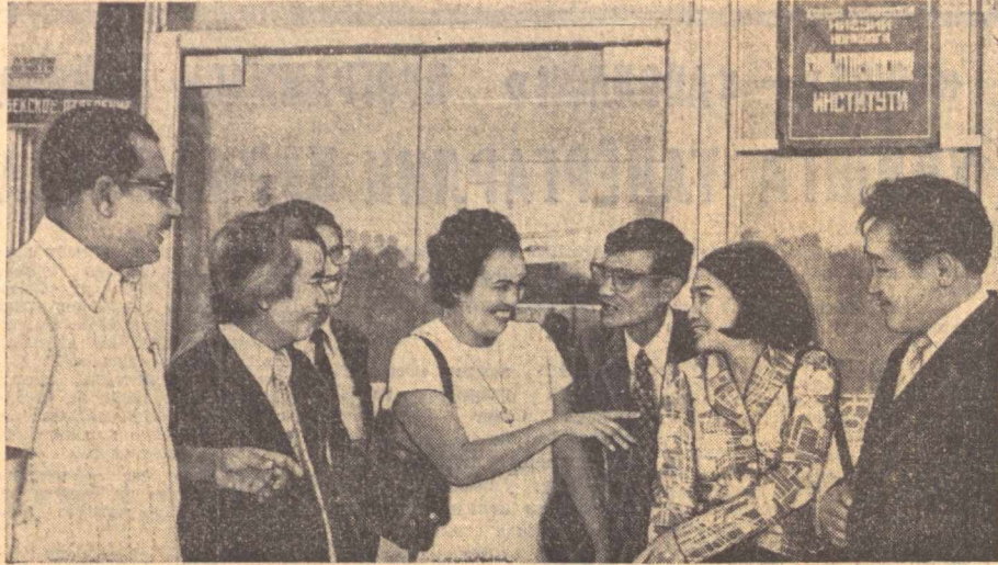
Суратда: меҳнатчилар ва ўларнинг она аъзолари учун корхоналарда овқатлангани ташкил этиш масалалари юзасидан Тошкентда бўлаётган халқаро семинар қатнашчиларидан бир гуруҳи.