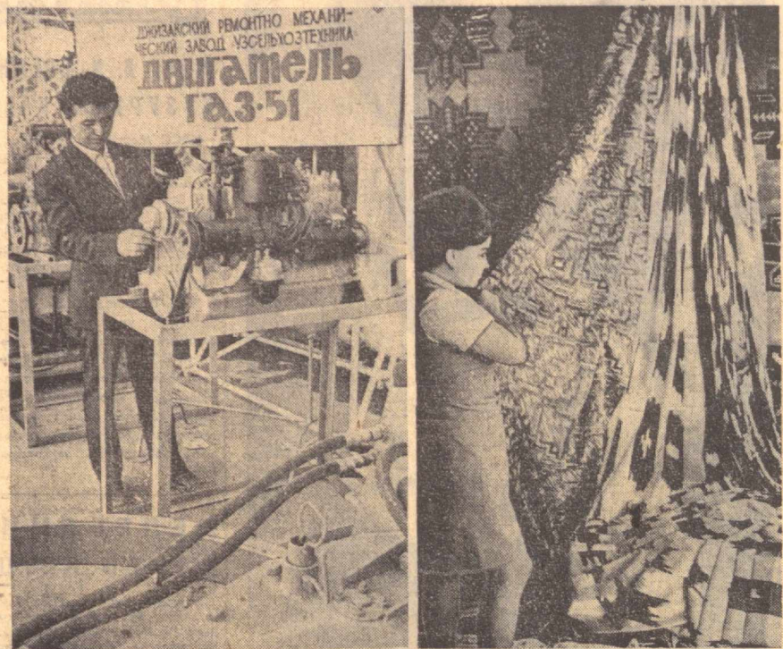
ДВОИЧАКОВ РЕМОНТНО МЕХАНИЧЕСКИЙ ЗАВОД УЗСЭЛЬУЗТЕХНИКА Двигатель ГАЗ-51