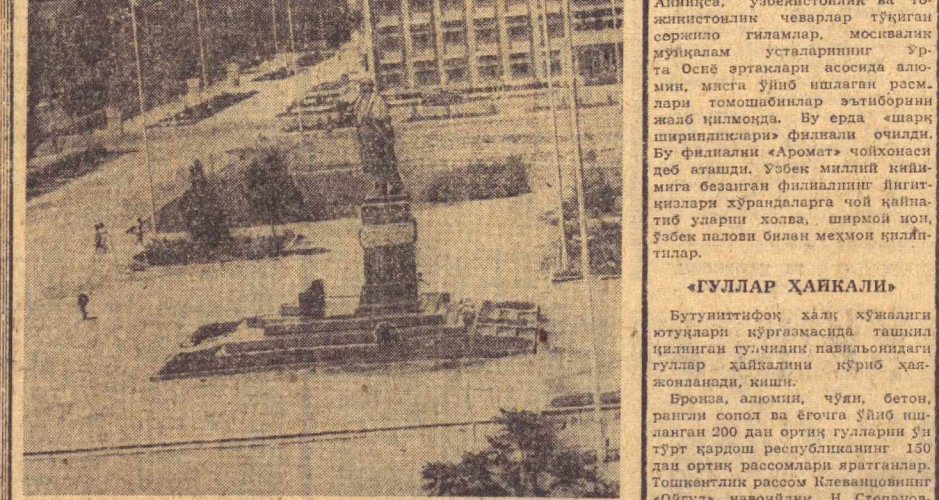
Корақалпоғистон АССРнинг пойтахти — Нукус шаҳри йилдан-йилга обод ва кўркам бўлиб бормоқда...