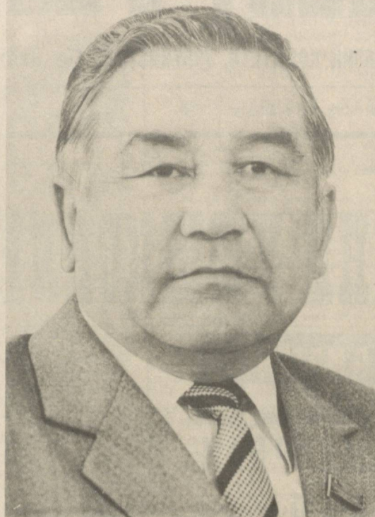
1978 йилдан буюн Ўзбекистон Компартияси Марказий Комитетининг секретари бўлди. А. Хўжаев коммунистик қўрилиш вази-фари амалга оширишда сабот-матонат ва ижодий та-би-ри-ни билан қўришдан иборат буюн ишга бағишлаган коммунистик партия ва совет халқининг содиқ фаразиди Асадилла Ашрапович Хўжаевнинг порлоқ хотира-си қалбларимизда абадий сақланиб қолади.

шаббос кўрсатди. А. А. Хўжаев Ўзбекистон Компартияси Марказий Комитетининг секретари лавозимида ишлаган даврда унинг ташкилотчилик қобилияти зўр куч билан ривожланди. У ишнинг кўзини адиқ билди, капитал қўрилишга партия раҳбарлиги масалаларини зўр гайрат ва собитқадамлик билан ҳал этар эди.