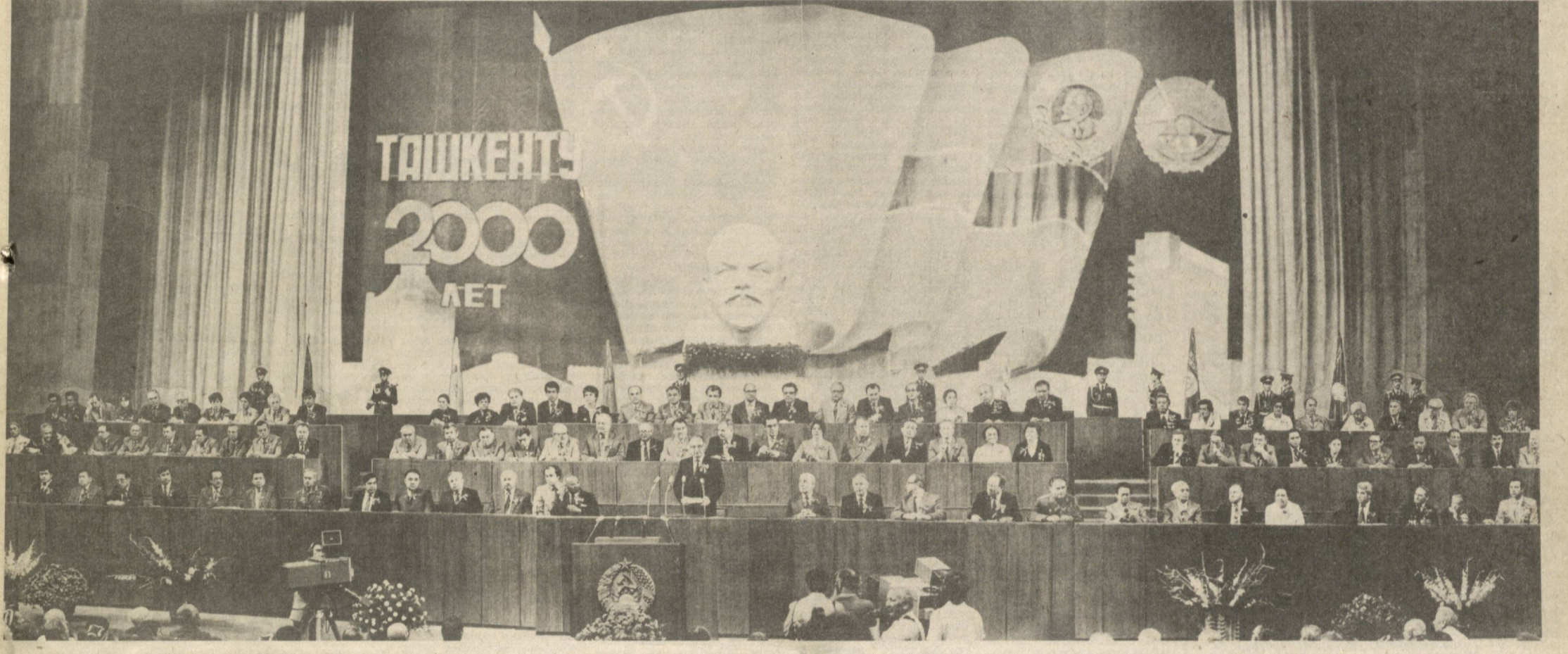
Тошкентнинг 2000 йиллигига ҳамда шаҳарга Ленин ордени топирилшига бағишланган тантанали йиғилиш президиуми.

Ранго-ранг байроқлар, паннолар ва транспарантлар Ўзбекистон пойтахтининг кўча ва майдонларига янада кўркамлик бахш этган. Ҳама жойда — кўп қаватли иморатларнинг пештоқларида, трамвайлар, автобуслар, троллейбусларнинг ёнларида тантана санасини билдирувчи «2000 йил» деб ёзиб қўйилган. Мамлакатимиз Шарқдаги энг катта индустрия ва маданият маркази, меҳнат ва мардлик шаҳри, ҳақиқатини айтиш керакки, деярли барча индустриал ва маданият маркази — Тошкент инки минг ёшда. Бу шаҳарнинг овозига — Тинчлик ва Дўстлик овозига барча қитъалардаги миллион-миллион кишилар қўлоқ солимоқдалар. Шаҳар меҳнатқашларининг революцион ҳаракатдаги катта хизматлари ва Улуғ Ватан урушидаги қалабага қўшган ҳиссаси, ҳўжалик ва маданий қурилишда эришган муваффақиятлари учун ва асос солинганлигининг 2000 йиллиги муносабати билан Тошкент шаҳри Ленин ордени билан мукофотланганлиги байрамга алоҳида фойз киритди. Тошкентликлар шонли юбилейни муносиб қутиб олдилар. Юбилей арафасини улар партия XXVI съезди топшириқларини муваффақиятли бажариш учун бошланган социалистик мусобақада янги ютуқлар билан, Ёр юзидagi тинчликнинг ишончли таянчи — социалистик Ватан қудратини ҳар томонлама ошириш йўлидаги умумхалқ курашига кўпроқ ҳисса қўшиш билан нишонладилар. КПСС Марказий Комитетининг 1982 (Давоми учинчи бетда).