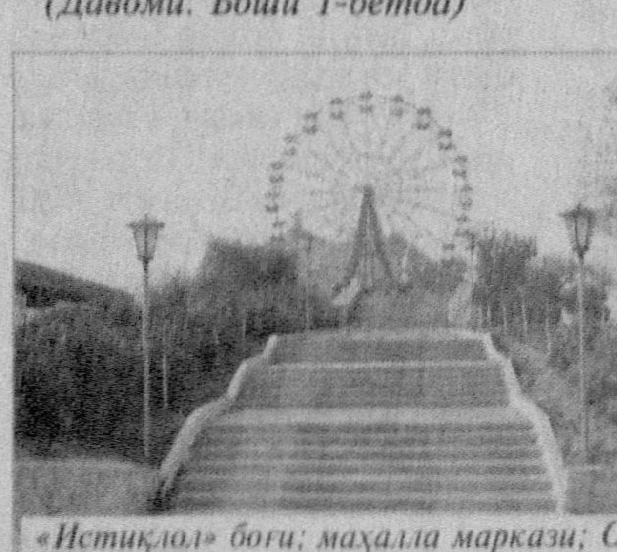
«Истиклол» боғи; маҳалла маркази; Олимпия захиралари коллежи ва вилоят солиқ бошқармасининг янги биноси.

Ташкилотнинг «Истикбол» ёшлар экологик бирлашмасининг ташаббус гуруҳи Тошкент педиатрия тиббий институтида 17 ноябрь — Халқаро талабалар кун ва 18 ноябрь — давлатимиз Байроғи қабул қилинганлиги кунни муносабати билан тадбир ўтказди.