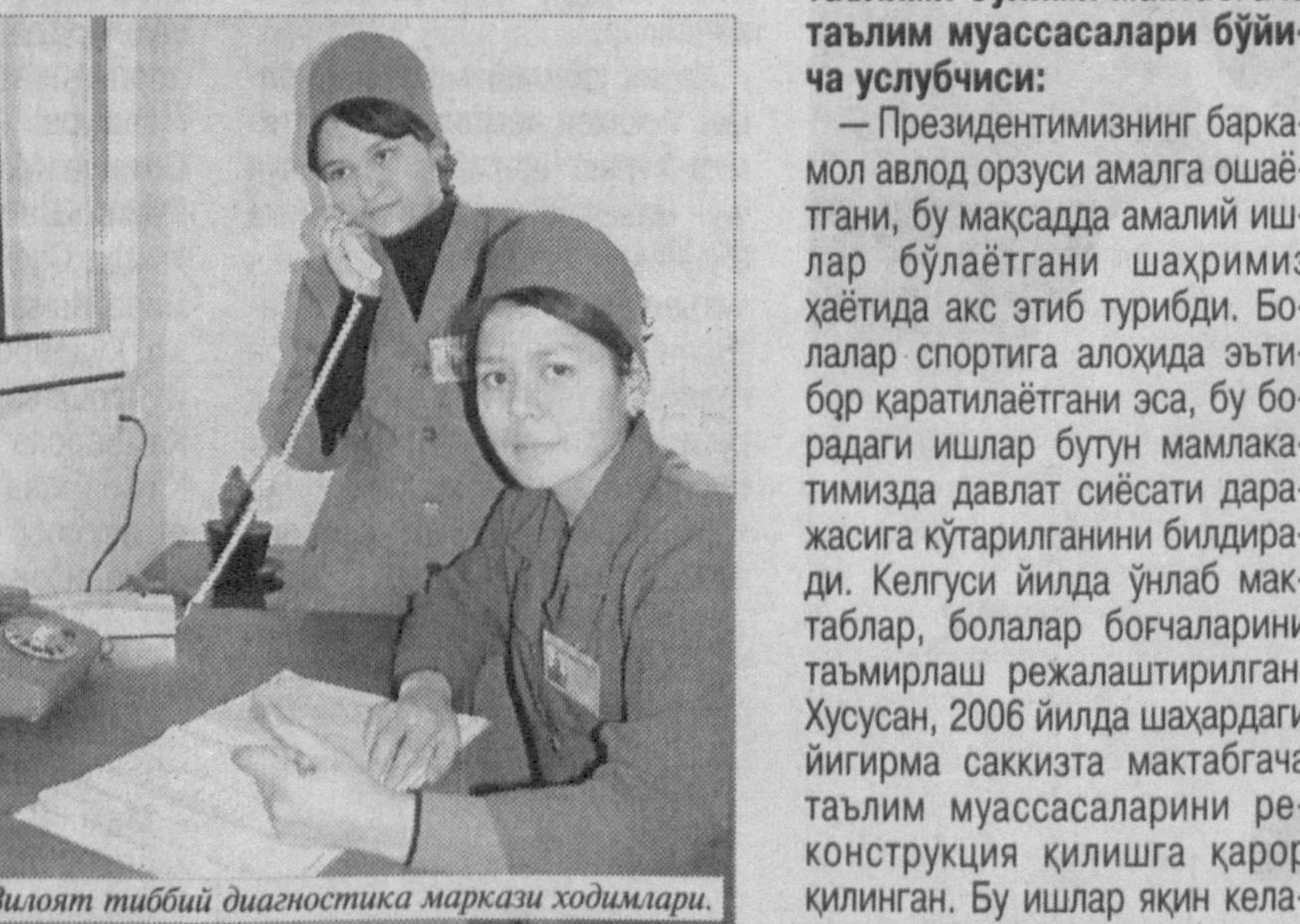
Вилоят тиббий диагностика маркази ходимлари.