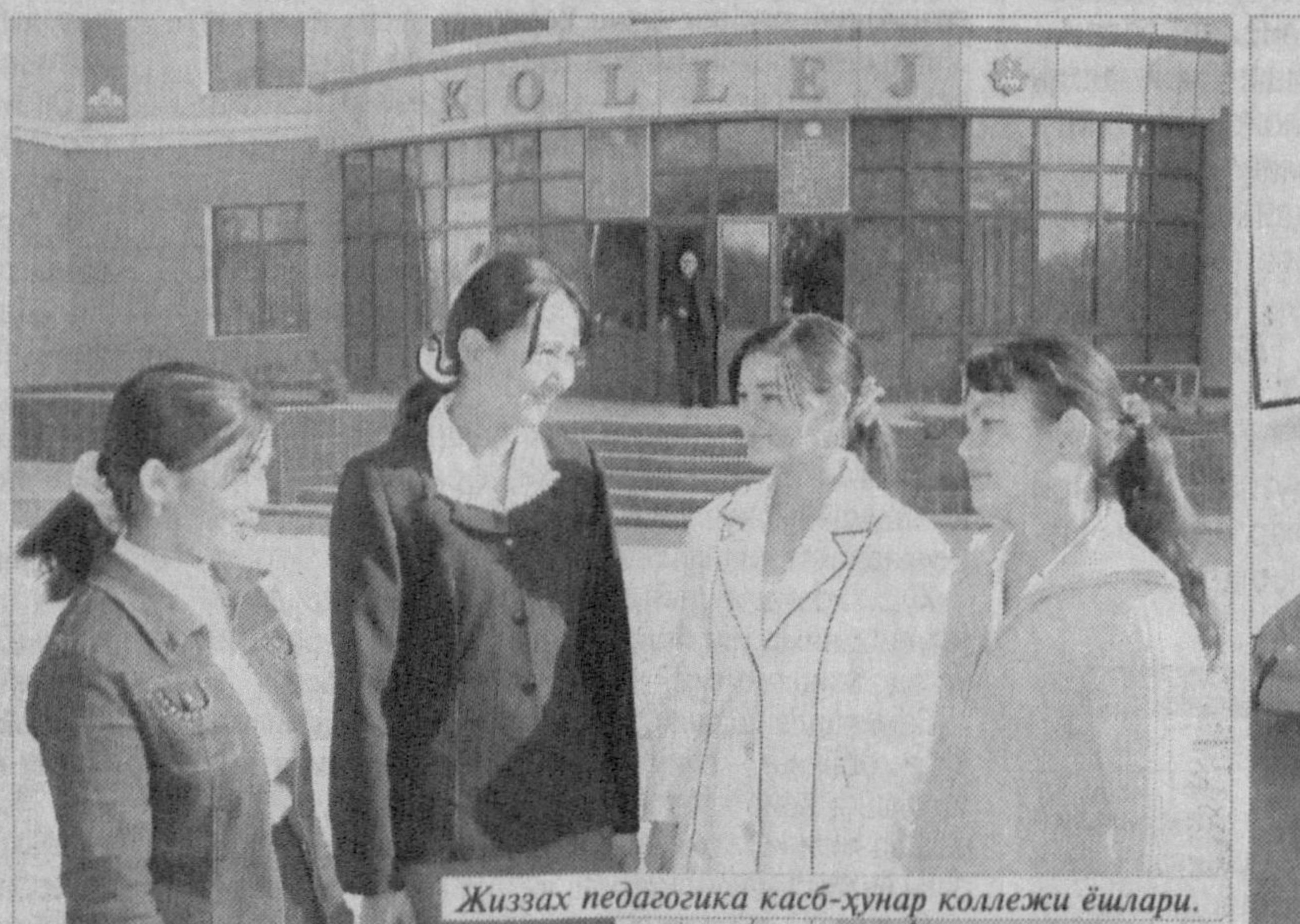
Жиззах педагогика касб-хўнар коллежи ёшлари.

«Нуроний» жамғармаси шаҳар бўлими раиси: — 2001 йилда қурилган шинам «Бахт уйи», «Маҳалла» ва «Камолот» марказлари, мухташам Маданият саройи бетақдор меъморчилик ечимига эга. Самарқанд томондан шаҳарга кираверишдаги тепалик устида 2002 йилда қурилган «Богшамол» дам олиш маскани, унинг маҳабати, қўрқил, таровати хусусида эса тўлқинланмай сўзлашнинг иложи йўқ. У куну тун, яқину йироқ масофадан шаҳарликлар ва шаҳримиз меҳмонларини ўзига чорлаб тургандай гўё. Очиги, баъзи бир раҳбарлар одамлардан фақат иш талаб қилади. Бу ҳам мустабид тазумдан қолган иллат. Одамларга дам олиш, яхши яшаш имкониятини ҳам бериш керак.