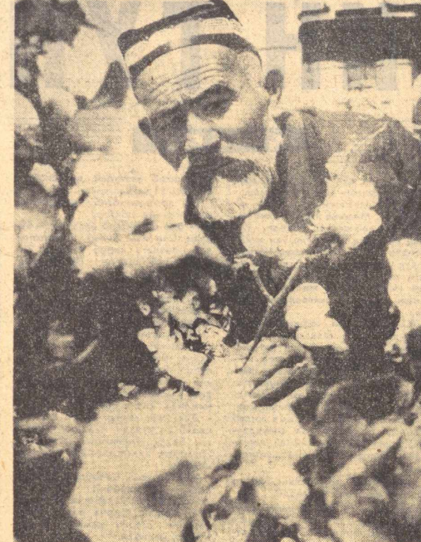
Ғўзалар фарзандек гул тегрангизда, Митти панжаларла дур этар тортик. Бу толалар беҳад муқаддас эрига, Сизга улар не-не кимдан олтига.