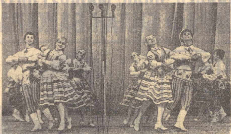
Ўзбекистонда ССР халқлари санъати фестивали давом этмоқда