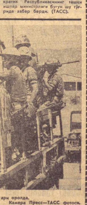
Кипрда аҳвол ҳамон кескинлигича қолмоқда. Суратда: турк қўшинлари оролда.

Республикаси ҳукумати билан Афғонистон ҳукумати ҳар икки мамлекат ўртасида элчихоналар даражасида дипломатия муносабатлари ўрнатилди.