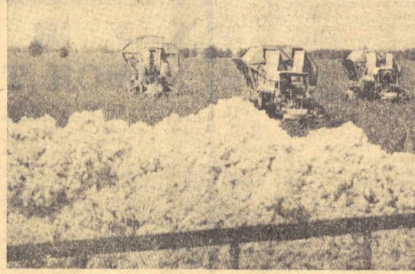
Кува райониди Димитров номи колхоз пахтакорлари 1000 тонна пахта майдонининг ҳар гектарыда 31,5 центнердан «оқ олтин» хирмони кўтариб, областда биринчида қатори галаба рапортига нима ченан эдилар. Мана бир неча кундиринг ҳирмоник зарҳўсулари мажбурийят ҳисобига пахта топиришмоқдалар. Даладара 18 та терим машинаси юсак умум билан ишлатилапти. Қўнига жамбурийят ҳисобига 3—3,5 процент ҳосил йиғилиб хирмонга тўқийлати. Суратларга: (чапдан) колхоз далаларида машина терими. Унга эса қўпнинг йилроғимини теринчи Насиба Ҳакимова.

Туриша парламентининг миллий палата раиси Камол Гўвен бошчилигида делегацияси Ўзбекистонда уч кўн меҳмон бўлиди. Туркиянинг ССРГА янчи Иктер Туркет делегацияси билан бирга бўлиди. Ўзбекистон ССР Олий Совети Президиуми меҳмонлар шароитида анибат берди. Зияфат аўстона ваъзилда ўтди. Туриша парламентининг аъзолари республинага қилган сафарини охириги кўнида Бухоро билан Самарқандга бордилар. Улар тарихий ёдгонларини кўриб кечирдилар, шу шаҳарларнинг ҳаёти билан танишдилар. (ЎЗАТ).