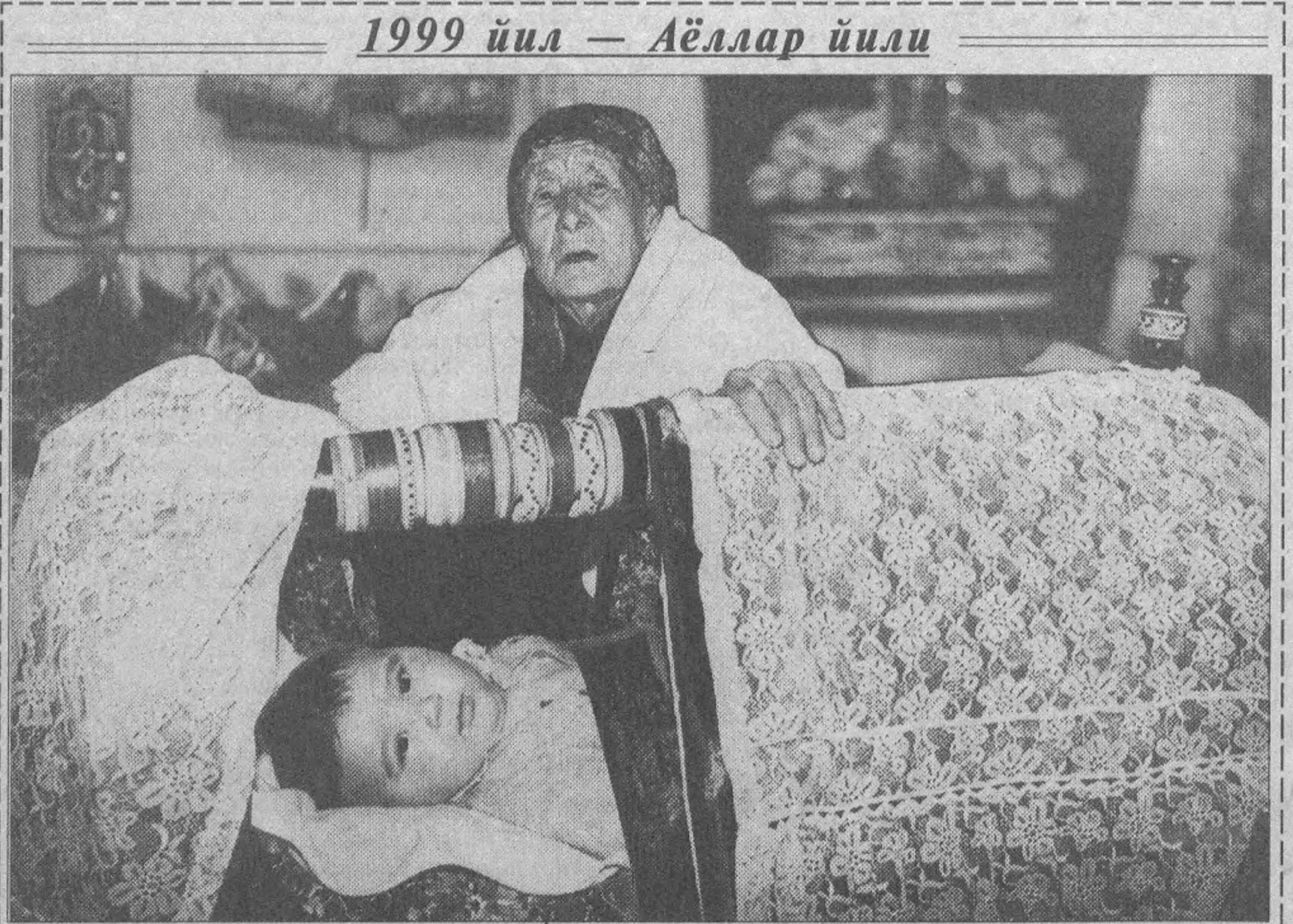
1999 йил — Аёллар йили