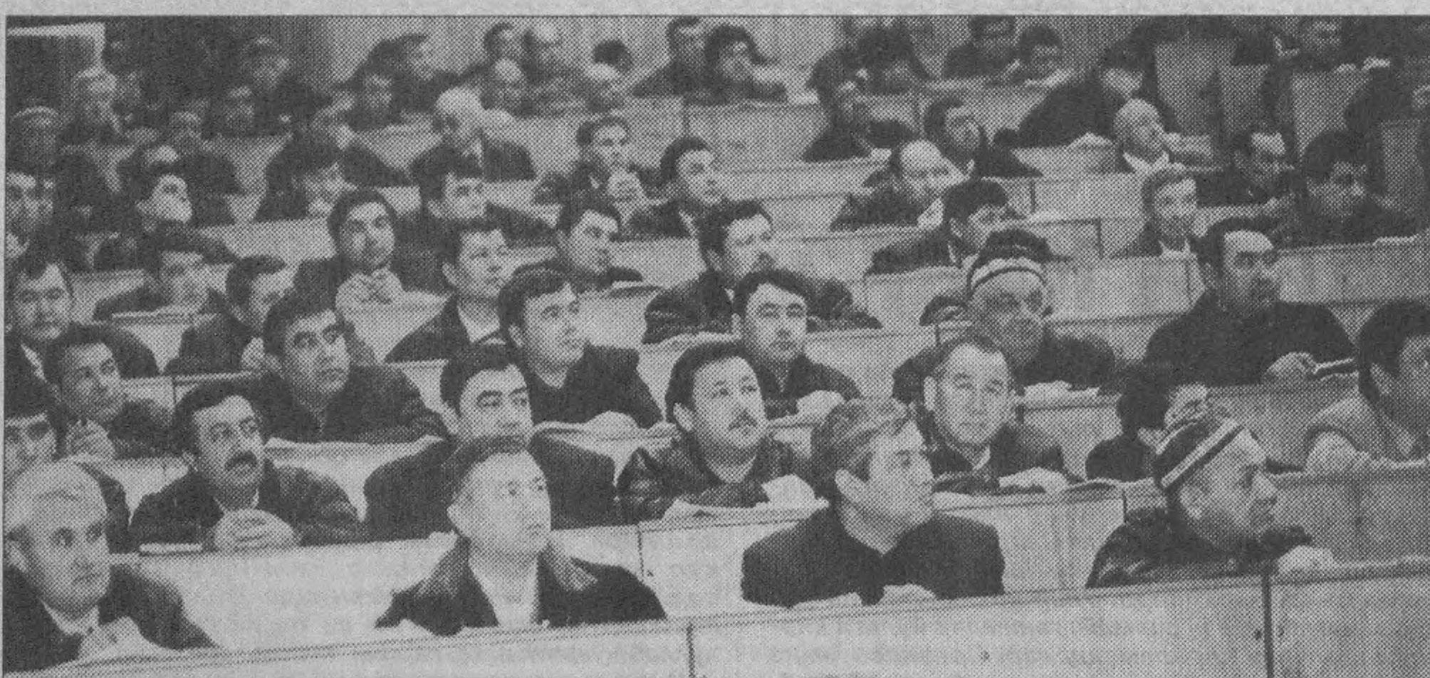
эмас, балки, маърузадан сўнг айнан шу мавзуда тингловчиларнинг чиқишлари, савол-жавоблар, баҳс-мунозаралар ҳам бевосита дастурга киритилди. Бу эса айнан шу соҳадаги камчилик ва нуқсонларнинг келиб чиқиш сабабларини ҳар томонлама, чуқур таҳлил этиб, яхши тушуниб олиш, уларни бартараф этиш ва бошқа муаммоларнинг ҳам ечимини топиш йўллари белгилаб олиш имконини берди.

Президент таъкидлаганидек, бу йилги ўқув навбатдаги кампаниябозликка айланб қолмаслиги учун унинг дастурини ишлаб чиқиш ва ўқув машғулотларини самарали ташкил этишга жиддий эътибор берилди. Чунинчи, бу сафар фақат олим ва тажрибали мутахассисларнинг у ёки бу мавзудаги маърузаларини тинглаш