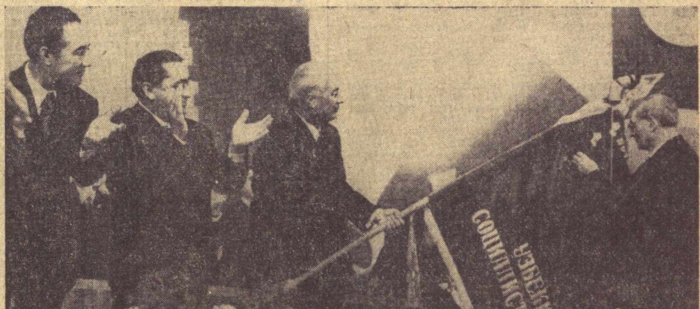
ТОШКЕНТ. Ўзбекистон ССРга Октябрь Революцияси орденининг топирилиши.