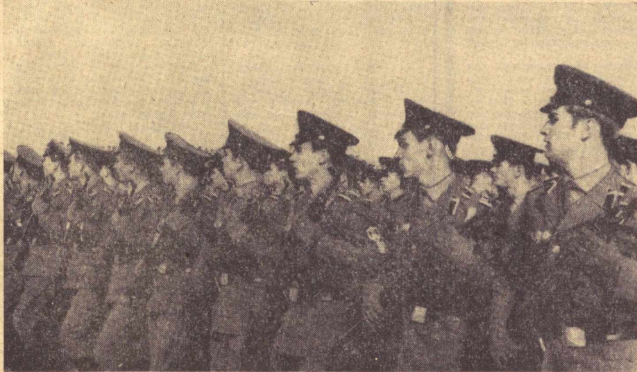
ТОШКЕНТ, 1974 йил 23 октябрь. В. И. Ленин майдони. Ўзбекистон ССР ва Ўзбекистон Компартиясининг эллик йиллигига бағишланган ҳарбий парад.