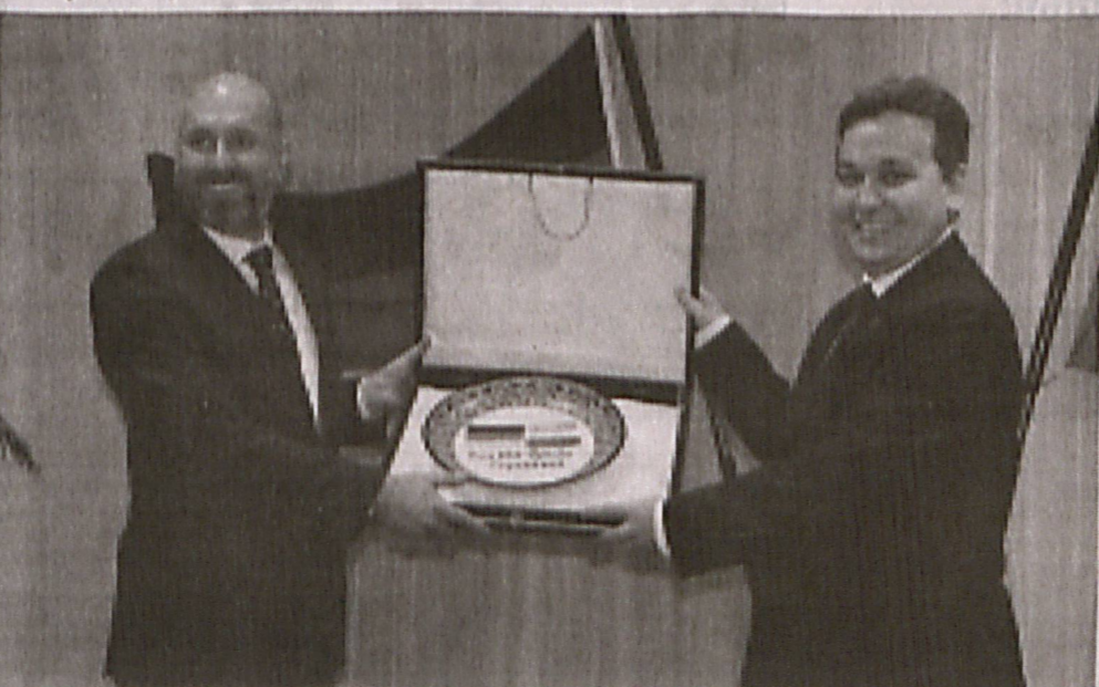
У этого учреждения, пожалуй, одна из самых интересных и долгих историй. Основано более века назад - в 1910-м, многие годы находилось в здании нынешнего Посольства Франции, а в 1985-м расположилось на новом месте. Особенную популяр-

В преддверии официального визита Президента Шавката Мирзиёева в Германию состоялась церемония присвоения столичной специализированной школе с углубленным изучением немецкого языка № 60 имени Иоганна Вольфганга фон Гёте.