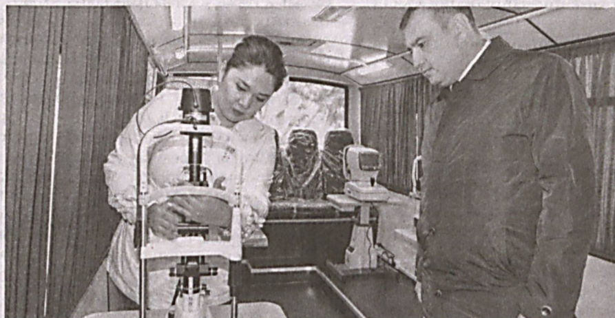
Для осуществления передвижных медицинских осмотров. Он оборудован кератометром, пневмотонометром, имеется оборудование для определения остроты зрения, подбора очков, биомикроскопическое медицинское оборудование, специальное зарядное устройство. Мобильная офтальмологическая клиника дает возможность организовать медицинские осмотры в любом месте.