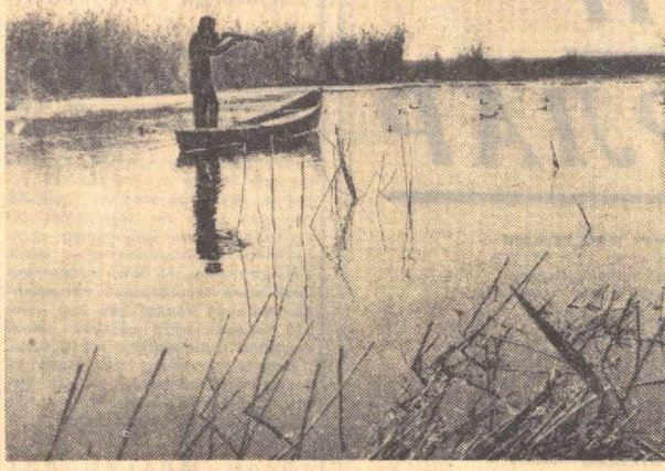
Қуш қаслида ов қилишнинг ҳам узинга хос гашти бор. Суратда: Қоракалпоғистон АССРнинг суе ҳавзаларида ов пайти. А. Лихварь фотоси, (3ЭТАГ).

Ф. ЗОҲИДОВ, «Совет Ўзбекистони» мухбири.