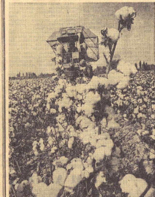
Республикамизнинг бошқа областлари каби фарғоналикларнинг ҳам бу йил омиди келди. 580 минг тоннадан ортиқ «оқ олтин» хирмони уйишди. Етиштирилган пахта ҳосилнинг 230 минг тоннадан кўпроғи машиналар бунеридан тўнланди. Ҳа, «зағори кема»лар Фарғона области совхоз ва колхозлари деҳқонларига қанот бўлди. Суратда: фото мухбиримиз Ж. Тураев мавсумда область хўжалиқларининг бирда машина теримини объектга туширган пайти акс этган.

У. ЮНУСОВ, Фарғона райониди «Фарғона» совхозининг директори.