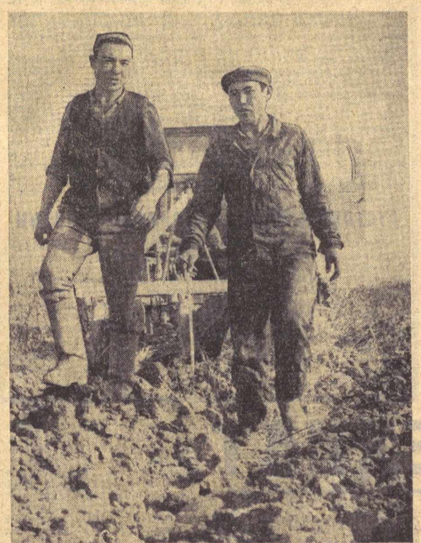
Тошкент области, Бўна районидидаги «Кунорол» совхозини деҳқонлари иеласи йил ҳосилига пухта замин яратмоқдалар. Шу кунларда хўжалик даладариде ҳосилдан бўшаган майдонлар сиратли шудгор қилинмоқда. Бу ишга 32 ҳайдов транзитри сафарбар этилган. Совхозда кунинга 150 гектар майдон шудгорланяпти. Сурата: Н. Қўзиев ва С. Шоймардоневлар. Ж. Тўраев фотоси.

Ўзбекистон ССР гўшт ва сут самноти корхоналарининг коллективларини маҳсулотининг энг муҳим турларини реализация қилиш ва ишлаб чиқариш ҳажми бўйича янги бир ойлик плани муддатидан илгари, 15 ноябрда bajarилди. Ноябрь ойининг охиригача пландан ташқари 18 миллион сўмликдан кўпроқ маҳсулот реализация қилинади. (ЎзТАГ).