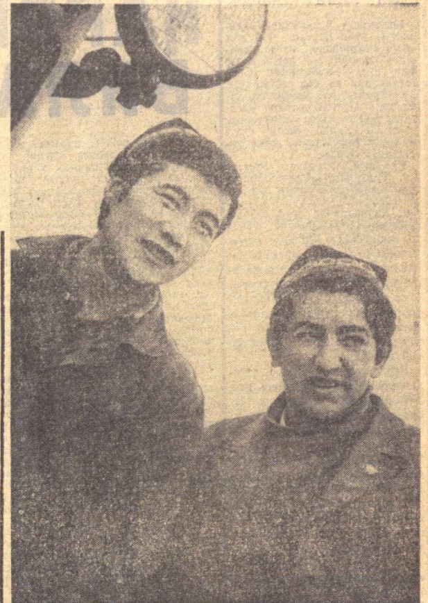
Наманган область, Косонсой районидаги «Кизил Октябрь» колхози деҳқонлари келгуси йил мул ҳосилга пухта замин яратмоқдалар.

МУЛ ҲОСИЛГА ЗАМИН ИЛГОР ХУЖАЛИКЛАРДАГИ ПУХТА ИШЛАР ШУДГОРЛАШ ДАВОМ ЭТМОҚДА