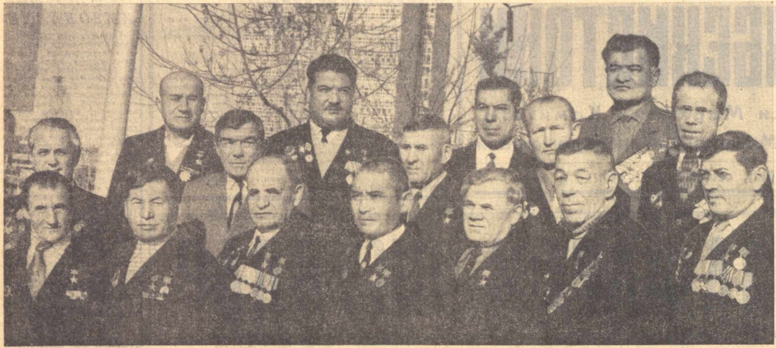
БУЮК ГАЛАБАНИНГ 30 ЙИЛЛИГИ ОЛДИДАН