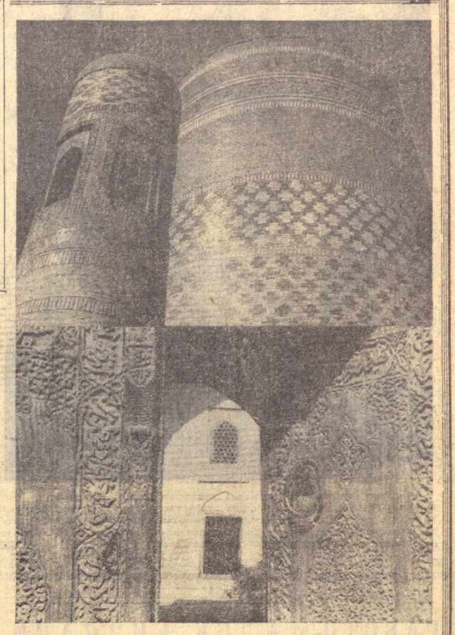
Музей шаҳар — Хива республикамининг диққатга сазовор ерларидан. Бу ерда келган савҳатчи туристлар Урта Осиёнинг қадимий меъморчилик санъати билан яқиндан танишдилар. Нева-неча асрларнинг шохиди бўлган минора ва гўмбазлар давлат муҳофазасига олинган. Суратларда: Налта минор (юқорида) ва қўш табақали ўймакор ашиқ.

Варакша қалъаси деворларига ишланган турли манзаралар ҳам диққатга сазовор. Тоқ янроқларига бурканган узум, тангаларни ялтираб турган балчиқ ёки камондан ўқ узишга тайёр турган мерган сингари тасвирлар танда нақшкор усулда яратилган. Қалъа деворларига манзарали расмлар ҳам ишланган. Айниқса, фил устида кенг шер билан жанг қилаётган оғир манзараси эътиборга лойиқ. Хуллас, топилмавлар асосида ташкил этилган кўргазма билан танишган киши ўзини санъати билан мулоқотда бўлади. М. АҲМЕДОВ, музейнинг илмий ходими. Суратда: дор устида моҳирлар бажарилётган пайт. эғиз қўзи олади. Биз беш йилликнинг якунловчи йилда ҳар юз бош совилқдан олингандан қўзилар сонини 200 тага етказамиз. Қўйлардан қўлаб жуи қирқчи оламиз. Термиз районидеги Қўбисhev номи колхоз чорвадорлари қишлоқнинг муваффақиятли ўтказишарди. Қишлоғига пухта таёргарлик қўрилган, еш-хашак етарли. Қўйчилик фермасига 500 тоннага яқин беда ва хашак гарамлаб қўйилган. Отарларда типовой қўтонлар барпо қилинган. Чўпонлар иссиқ қилинган ва ўтов билан таъминланган. Бу табиқларнинг ҳаммаси чорва қишлоқининг бениқим ўтказиш имкониятини беради. Х. ЖУМАЕВ, Термиз районидеги Р. Ғулом номи мактаб ўқитувчиси.