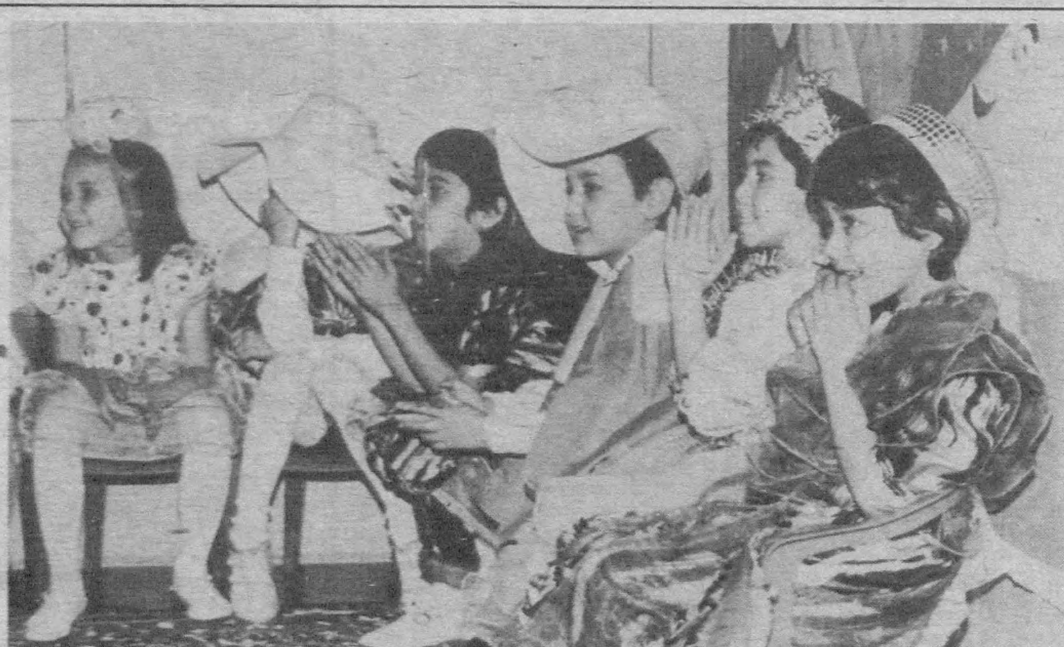
Болалик... Бу мурғак ёшда ким ҳам байрамларни севмаган дейсиз?! Айниқса, кечалари билан ухламай, байрам тонгини сабрсизлик билан кутган, ойижонисини ҳоли-жонига қўймай, чиройли қўйлақлар тикдириб, уни ойна олдида неча бор кийиб кўрган болакайларнинг қувончи ўзгача бўлади. Мана бу суратта қаранг-а! Жажжи ўғил-қизларнинг юзларидаги завқ-шавқни, ҳаяжонни кўриб, беихтиёр: «Шуларнинг бахтига юрт омон бўлсин, кўрганларимиз фақат байрам бўлаверсин!» дейсиз.