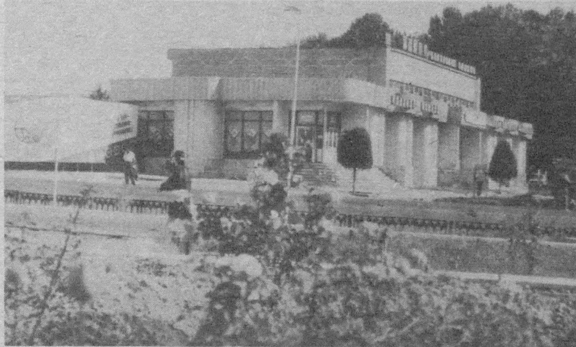
Туман марказида миллий меъморчилик анъаналари асосида бинолар қурилиши кенгайиб бормоқда.