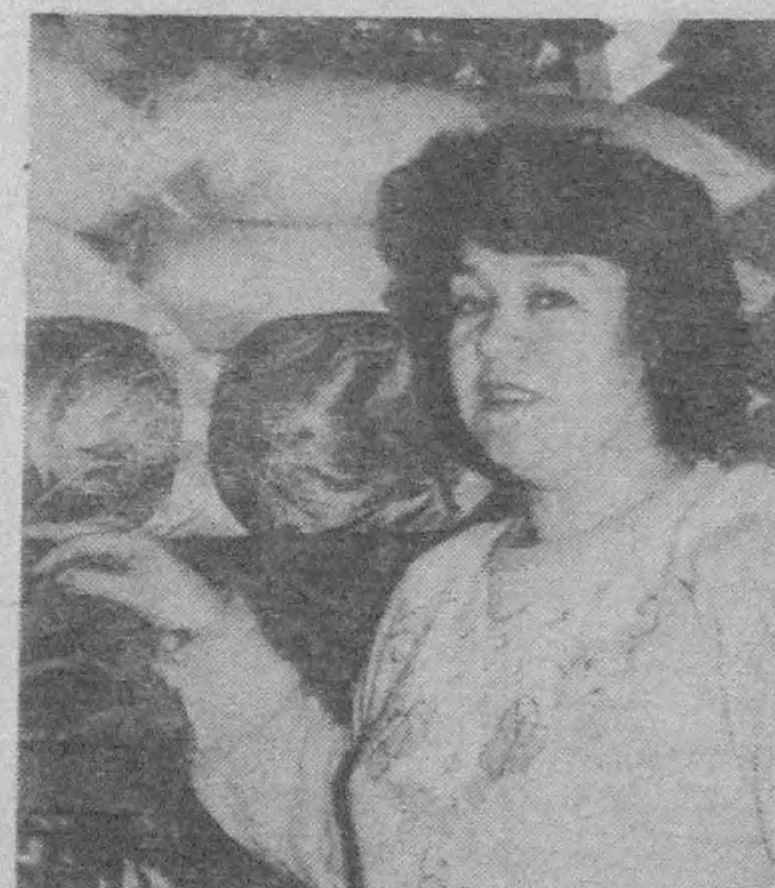
СУРАТЛАРДА: конференция пайти; Бу бири-биридан чиройли истеъмол моллари хотин-қизларимиз қўли билан яратилган.