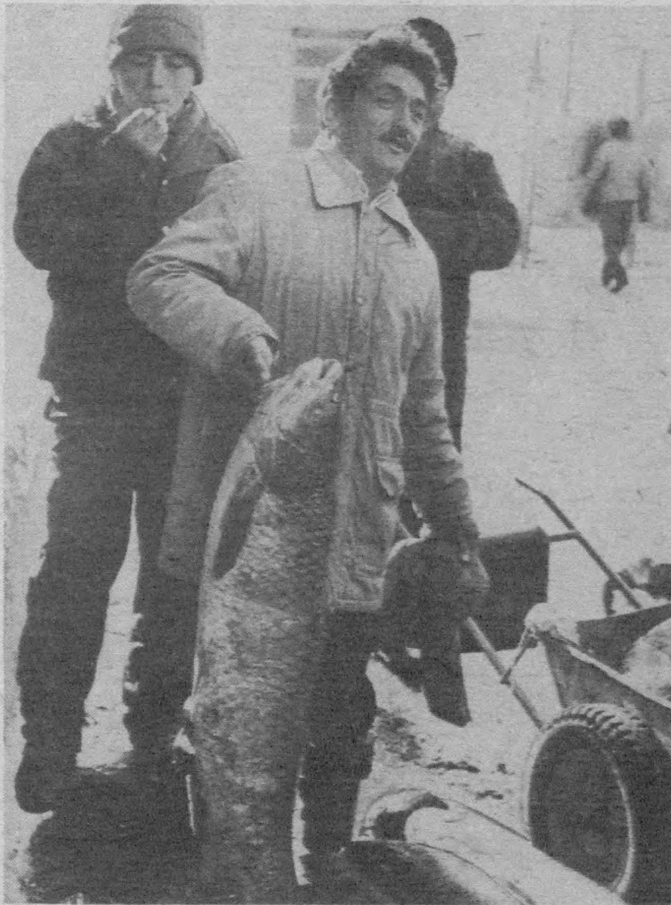
Қанча тош босар экан?