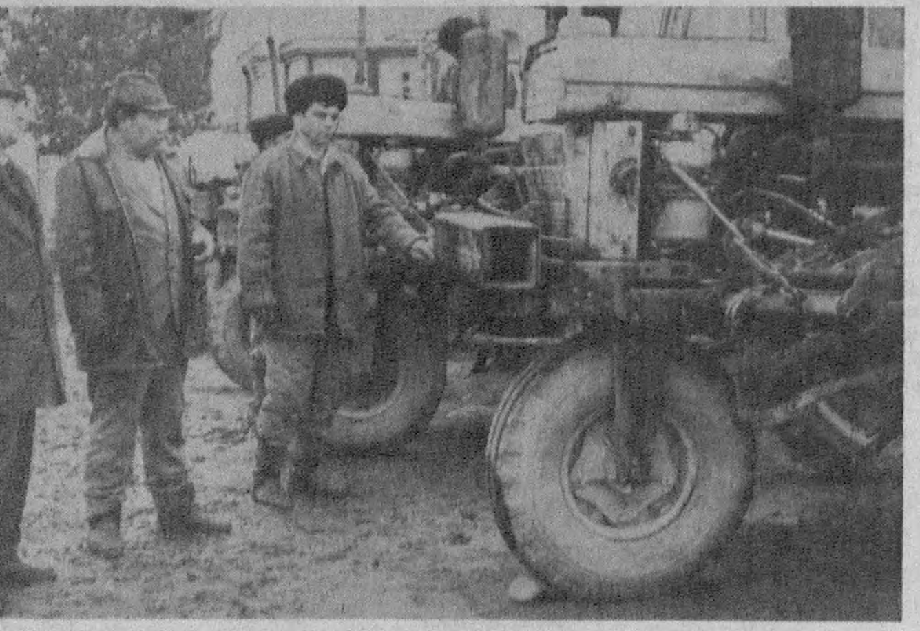
Пискент туманидаги Исломдоддин Хайдаров номи жамоа ҳўжалигида техника осонлари қўлга киришди...

Ташқарида қиш. Дов-дарахтлар ҳам фаслга мос либосда. Иссиқхонда эса... Бобо-деҳқонлар бир қулроқ ва икки қулроқ қўчталар ерга қадалган қундан бошлаб туну-кун иқтинг атрофида парвона бўладилар.