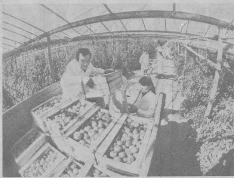
Самой высокой в республике отдачи тепличного гектара добился труженник колхоза «Ленин юлы» Ташкентского района.