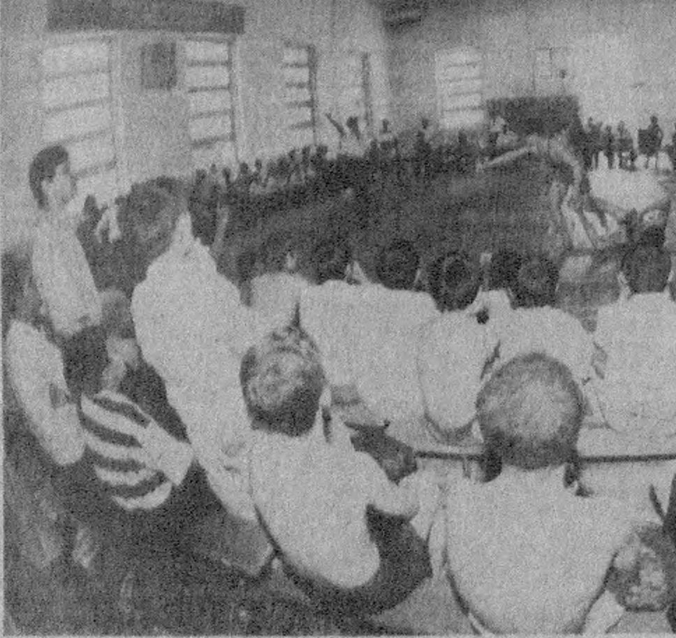
Суратда: мусобақа пайти.