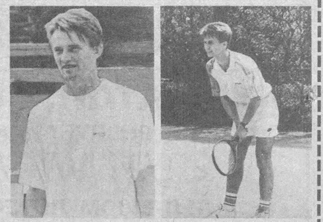
қаро турнир олдидан катта синов бўлади.

ТОШКЕНТДАГИ «Динамо» ўйингоҳида бошланган ёш теннисчиларнинг халқаро мусобақаларини самарқандлик ва фарғоналик спорт муҳлислари ҳам катта қизиқиш билан томоша қилдилар.