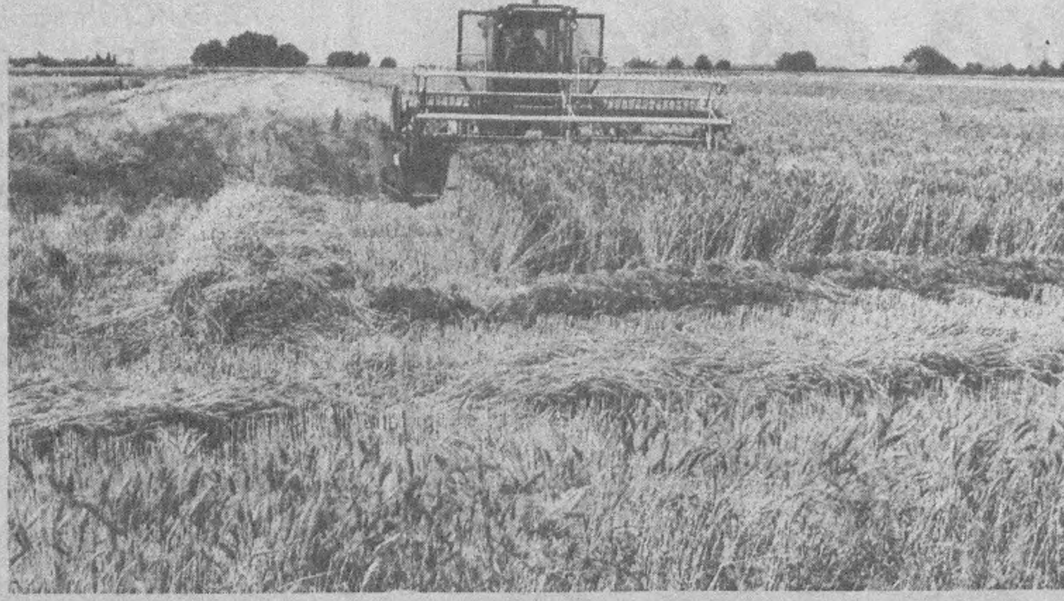
Халқ корпорацияси ғаллазорларида ўрими-йғим пайти.

Мирсоат Мамарасулов бошлиқ бригада дехқонлари ҳам ўрими-йғимни уюшқоқлик билан ўтказмоқдалар. Бу жамоага 140 гектар бугдойзор бирикитилган бўлиб, улар ҳар гектаридан 35-40 центнердан ҳосил олиш учун курашмоқдалар.