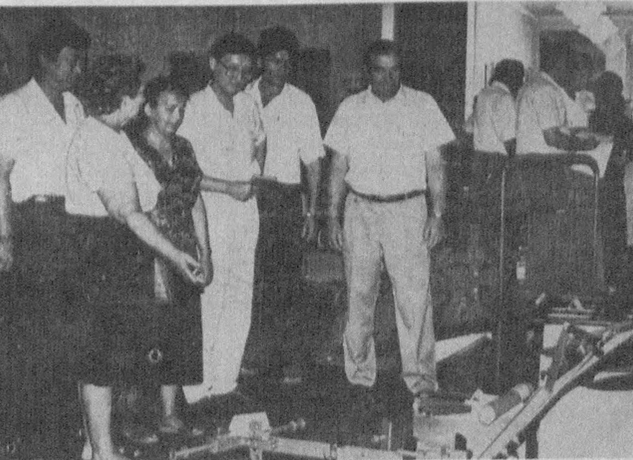
Савдо-саноат ярмаркасининг олинган лавҳалар.

М. МИРҲАМИДОВ , «Тошкент ҳақиқати»нинг махсус мухбири.