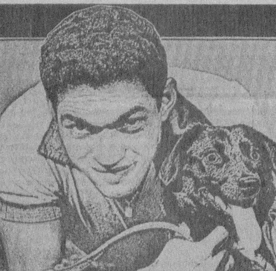
Англия. Олтимыш олтинчи йил июли. Бу Манозав Франсиско дос Сантос (ёки — Маэно, ёки — Гарринча)нинг Бразилия терма командаси сафиндаги охириги расмий уйини эди. Бу унинг жаҳон чемпионатларида охириги қатнашгани бўлганди. Бу унинг ва команданинг олдиде галаба қилиш учун, «Учинчи кўлга киритиш учун энг муҳим, энг назик ва ҳал қилувчи палла бўлган эди. Худди шундай — ўқлов харфлар билан ҳамма Бразилия газеталари биринчи саҳифаларида ана шу ўмидаҳиз рақамини ёзишганди. Унинг галабани улардан олдидега етган астойдил ва қатъий талаб қилаётганди. Чемпионликдан бошқа ҳеч қандай натижани улар тан олишмасди. Ҳатто кўмуш медаллар ҳам бразилияликлар учун шармандали қоқилди деб қараларди.

ЖАВОБ: 1994 йил 1 июдан кўча қирган Қонунга асосан уруш қатнашчиларининг пенсияларига энг кам ойлик иш ҳақининг 50 фоизи миқдоринда устама бериш назарда тутилган. Бундан ташқари пенсия тайинлашда талаб этилагандан ортиқча иш стажининг ҳар бир тўғри йили учун пенсиянинг асосий миқдорини пенсияни ҳисоблаб қарашиш учун олингандаги ўртача ойлик иш ҳақининг 1 фоизи миқдоринда оширилади.