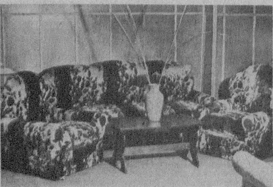
Ушбу суратларда бирлашма цехларидаги ишлаб чиқариш жараёнлари ва тайёр маҳсулотлари кўриб турибсиз.