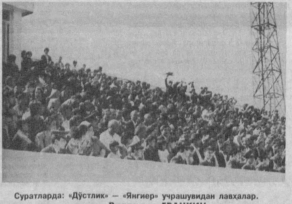
Суратларда: «Дўстлик» — «Янгир» учрашувидан лавҳалар.

Биринчи турдаги 8 та учрашунинг 4 тасида майдон эгалари, 4 тасида эса меҳмонлар устун келишди. Бирок дарвозаларга тўплар киритишда меҳмонларнинг натижалари юқорироқ бўлди. Улар майдон эгаларининг 10 та тўпига 13 та тўп билан жавоб қайтардилар.