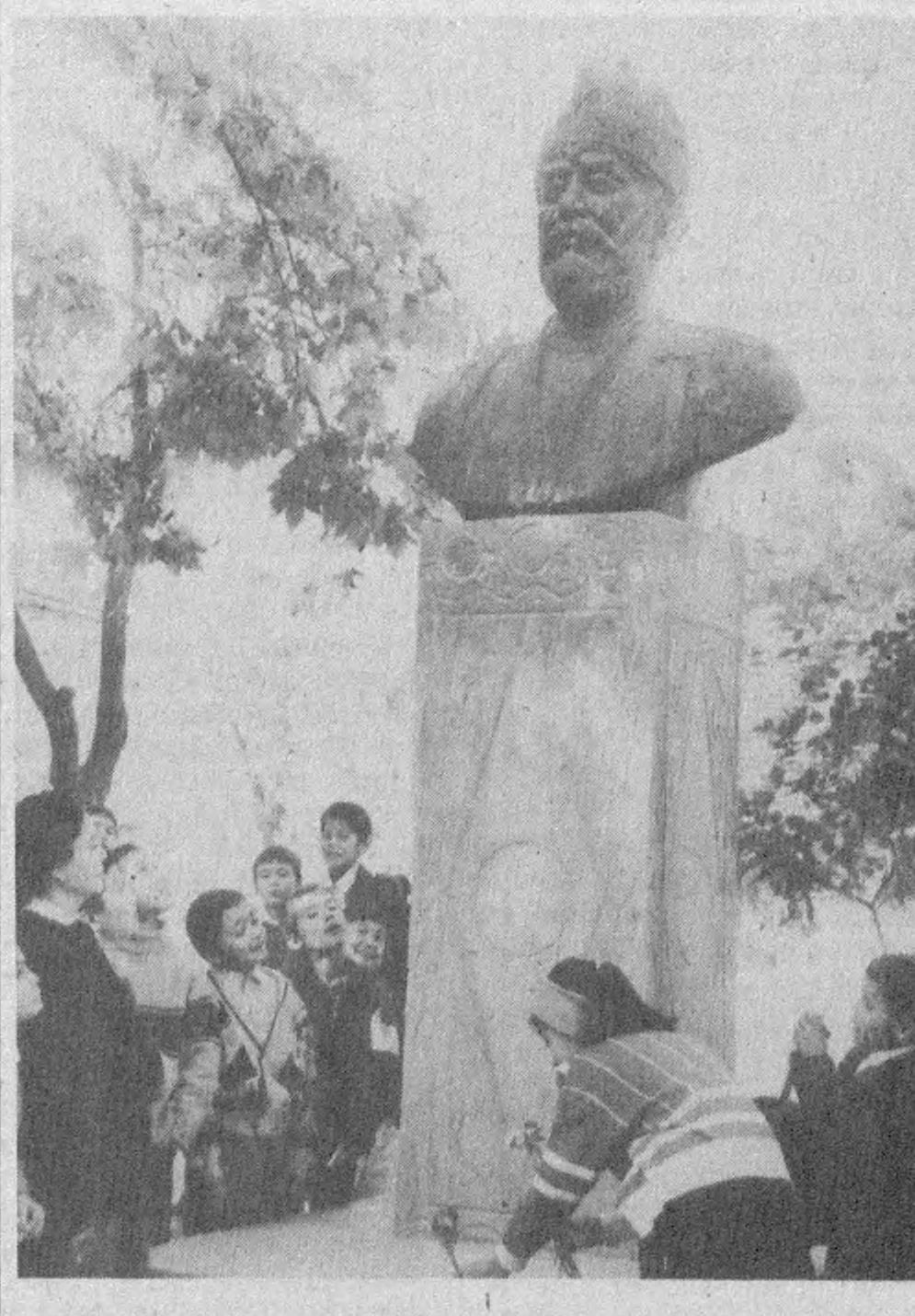
Қиёбай туманидаги мактаблардан бири улуг саркарда, давлат арбоби Амир Темур номи билан аталади. Мазкур мактаб ўқувчилари Соҳибқироннинг 660 йиллиги муносабати унинг ҳаёти ва фаолиятини янада чуқурроқ ўрганиш учун турли тадбирлар ва машғулотларда фаол катнашмоқдалар. Суратда: Амир Темур ёдгорлиги пойга қўйилмоқда.