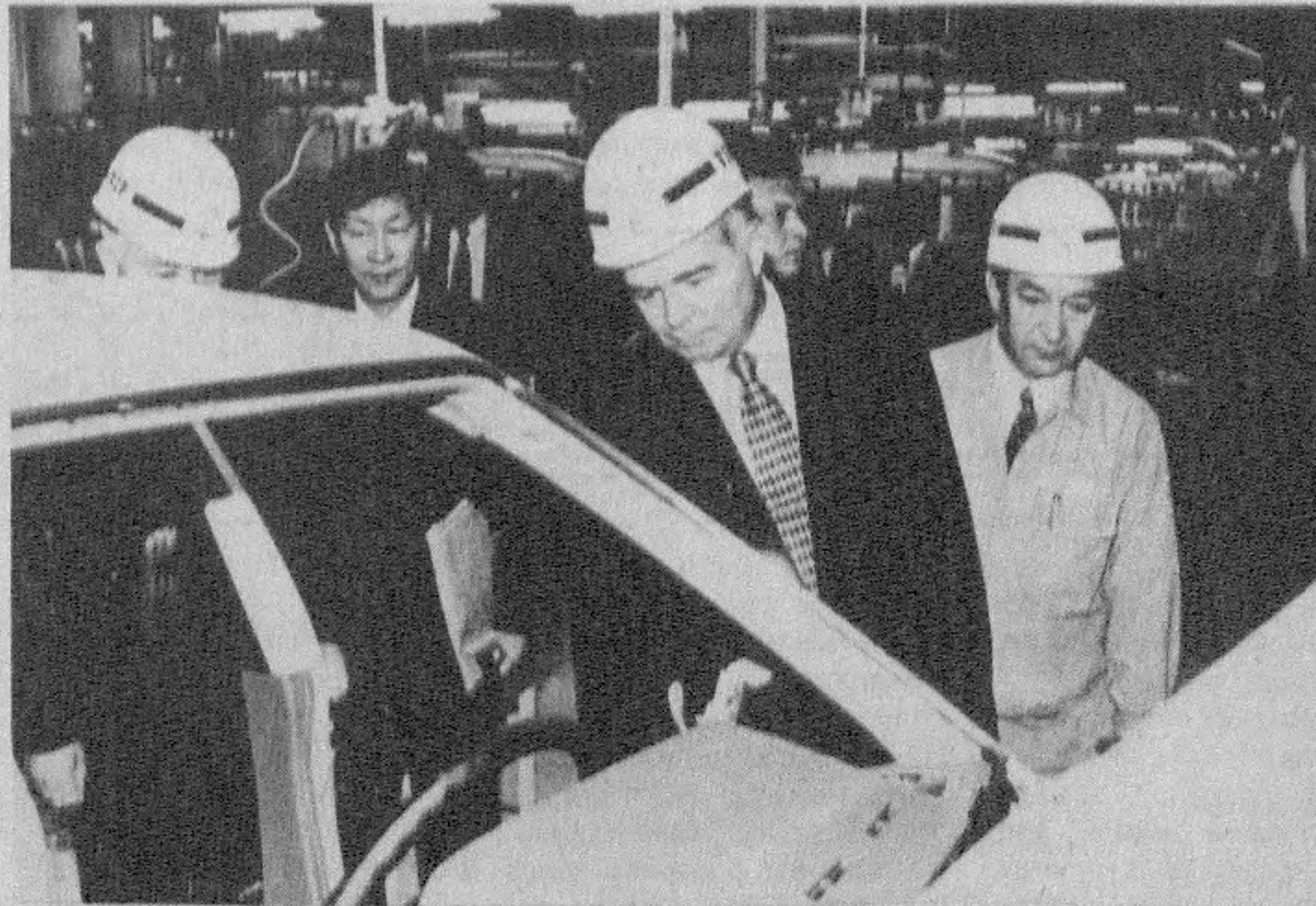
• Корхона цехларида.

рилганлар Корея Республикаси Президенти Ким Ен Самининг, Ўзбекистон Президенти Исло Каримовнинг видеотабриқларини кўрдилар. Президентлар ўз табриқларида икки мамлакат ҳамкорлиги катта самаралар бераётганини, «Ўздэуавто» заводи ана шу самаралардан бири эканини таъкидладилар. Икки мамлакат халқларини, жумладан тантана иштирокчиларини муомувока билан табриқ етдилар. Шундан сўнг Ўзбекистон ва Корея Республикаси санъаткорлари иштироқда катта концерт дастури намойиш этилди. (ЎзА).