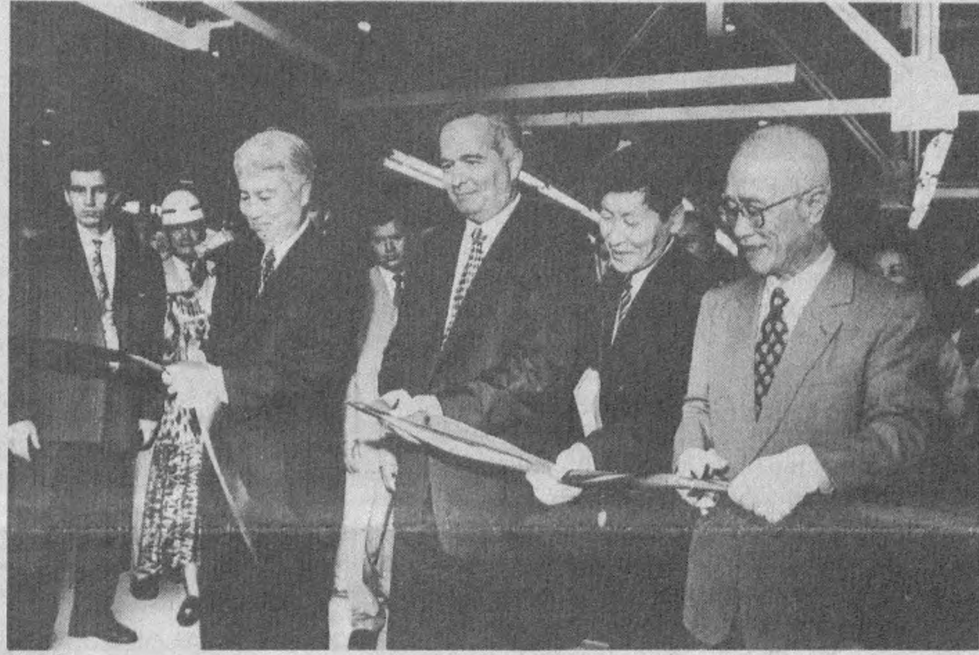
• «Ўздэуавто»нинг тантанали очилиш маросими.

• Иккинчи линияни ишга тушириш муддати ҳам қатъий қилиб белгиланганди. Завод конвейеридан «Тико» автомобиллари туша бошлади. • Ниҳоят, «Нексия» русумли автомобилларни ишлаб чиқаришга мўлжалланган учинчи линия ҳам ишга туширилди. • Жорий йил домида корхонада жами 29875 та автомобиль ишлаб чиқариш режалаштирилган. Ҳозир конвейердан кунига 5 та «Дамас», 2 та «Тико» машиналари тушмоқда. • Яқин йиллар ичида эҳтиёт қисмларнинг 30 фоизи (кейинроқ 70 фоизи) мамлакатимизда ишлаб чиқарилади. Шу мақсадда ҳозир Жанубий Корея билан ҳамкорликда «Ўз Корам», «ЎзДонг Жу», «Ўз Тонг Хонг», «Ўз Донг Янг» деб номланган тўртта қўшма корхона барпо этилмоқда. • «Ўздэуавто» лойиҳа қувватига тўла эришгач, йилгига 200 мингта автомобиль ишлаб чиқарилади. Ходимлар сони 4,5 минг кишига етади.