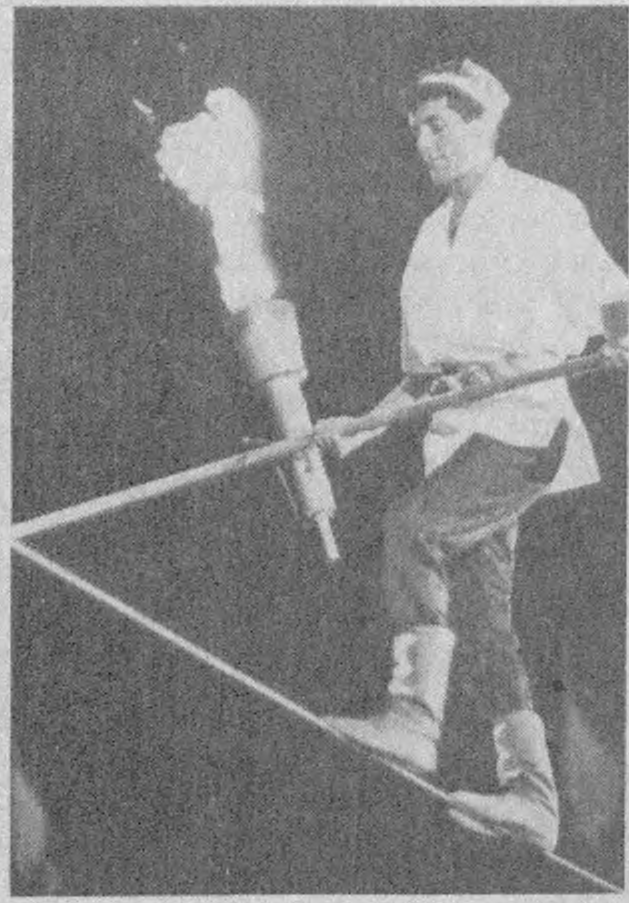
Биринчи Марказий Осиё ўйинлари машғулиси ана шундай ёқилди.