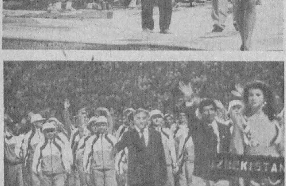
Суратларда: Беш мамлакат терма жамоалари.