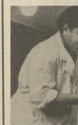
амбулаторияларни, дорихоналар ишлатиб турибди.