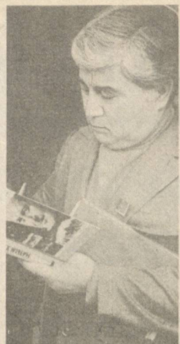
бейнинг мартабаси уникидан ҳам баландроғ-у!

— Унда, Муста-бей, деб ўзгартириб қўя қолинлар. — Йў-э, ахир Муста-