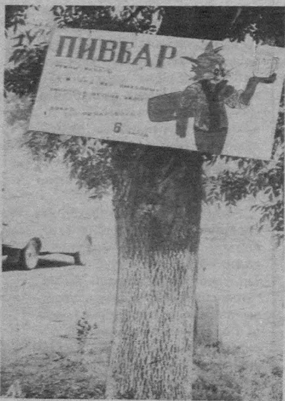
● Изоҳга ҳоҳлат йўқ