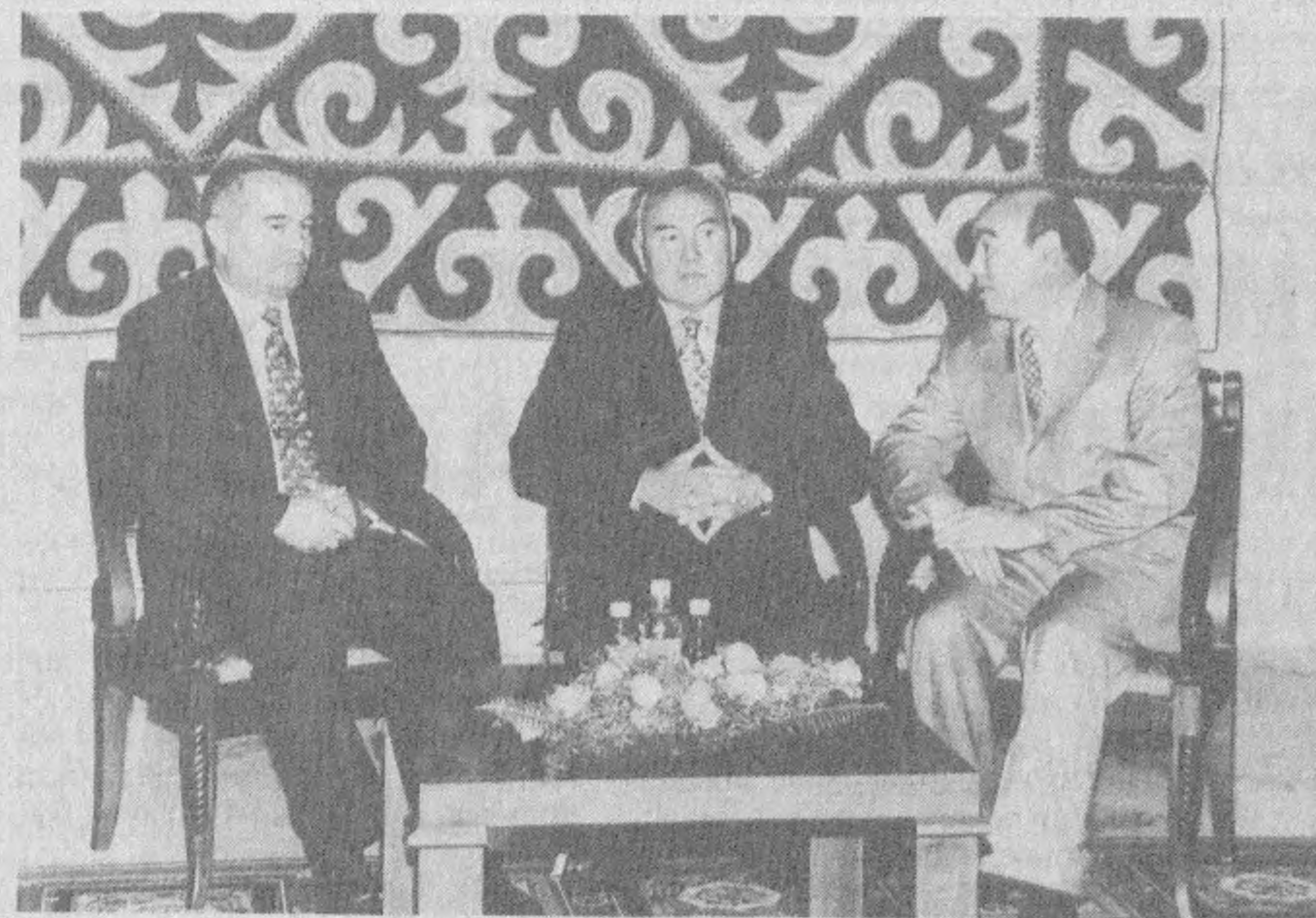
Суратда: Алмати учрашуви.

Илгари хабар қилинганидек, Президент Ислоом Каримов бошчилигидаги Ўзбекистон делегацияси 23 август куни Қозғистон пойтахти Алматида бўлди. Давлатимиз раҳбари Ўзбекистон, Қозғистон ва Қирғизистон Республикалари давлатлараро кенгаши йиғилишида ҳамда атоқли қозок оқини Жамбул Жабаев таваллудининг 150 йиллигига бағишланган тантаналарда иштирок этди.