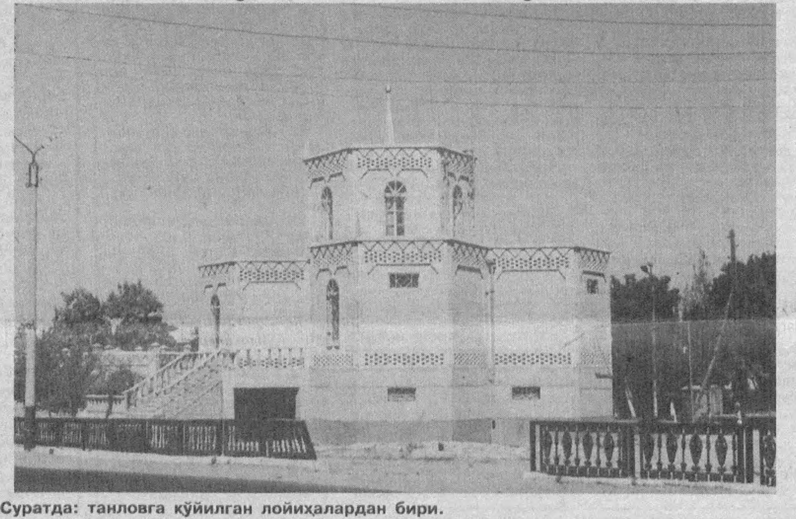
Суратда: танловга кўйилган лойиҳалардан бири.

Кенгашда амалий тақлифлар ва мулоҳазалар ҳам билдирилди. Чунончи, мутахассислар шаҳарлар ва туманлар қиёфасидаги ижобий ўзгаришларни таъкидлаганлиги ҳолда айрим янги меъморлиқ ечимларнинг баҳсли эканлигини ҳам таъкидладилар.