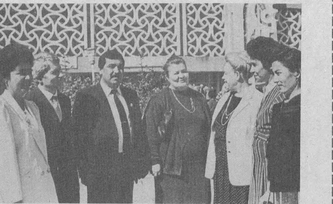
Суратда: тантанадан лавҳалар.

Сўнгги йиллар ичида қиёфаси тобора кўркамлашган бу шаҳар аҳли ёш авлод устозлари, мураббийларини шарафлаш учрашувига эрта тонданоқ йиғилдилар. Кимёгарлар саройида кираверишдаги майдонда вилоятнинг турли шаҳар ва туманларидан ташриф буюрган, ишда алоҳида намуна кўрсатган 127 нафар ўқитувчилар хушчақчақлик билан кутиб олинди. Байрам бошланди. Бир зумда даврага фойз кирди. Президентимизнинг «Республика халқ таълими соҳасида алоҳида ўрнатилган ходимлардан бир гуруҳини мукофотлаш тўғрисида»ги Фармонида кўра вилоятимиздан бундай шарафга муяссар бўлган ўқитувчилар исми-шарифи ўқиб эшиттирилди.